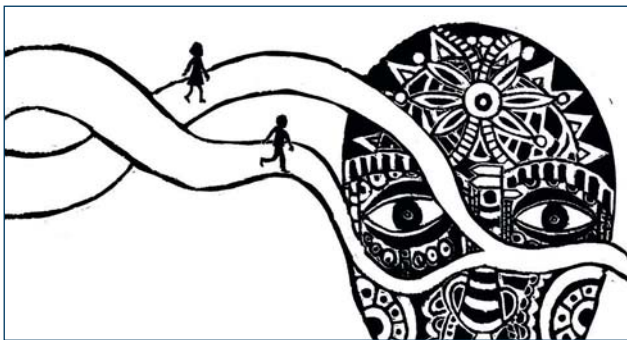
Les origines de Paco