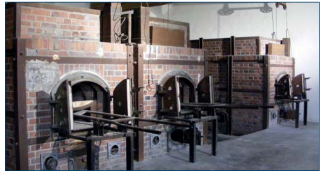
Nouveaux crématoires : Tout doit disparaître.