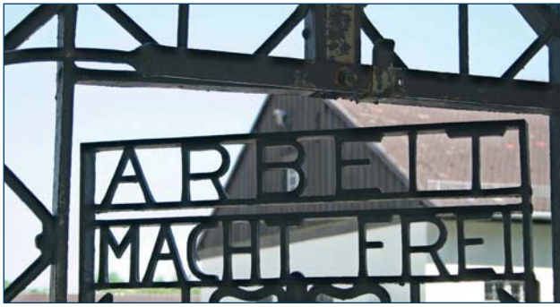
Pour ceux qui en doutaient encore!