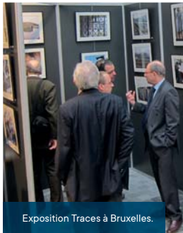
Exposition Traces à Bruxelles.

70 clichés photographiques répartis en 2 catégories